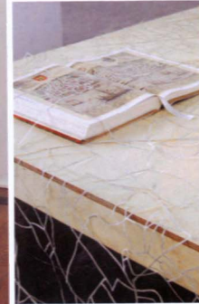
MODERNO Y CONTEMPORÁNEO IZDA.: INSTALACIÓN DEL ARTISTA SUBODH GUPTA, REALIZADA EN 2011; ARRIBA: CIDADES INVISÍVEIS DE LA ARTISTA BRASILEÑA ROSANA RICALDE, TAMBIÉN DEL AÑO 2011.